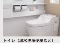
トイレ (温水洗浄便座など)