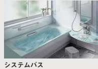
システムバス (浴室換気乾燥機など)