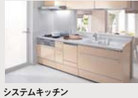
システムキッチン (コンロ・レンジフードなど)